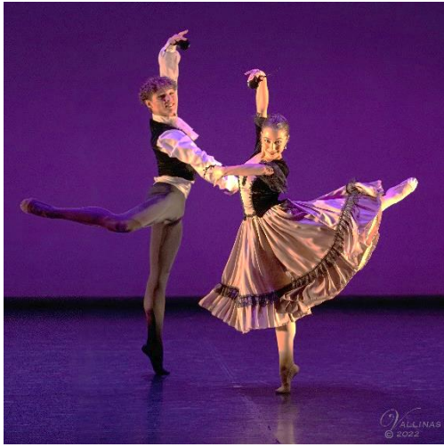
Danza Española (Escuela Bolera)