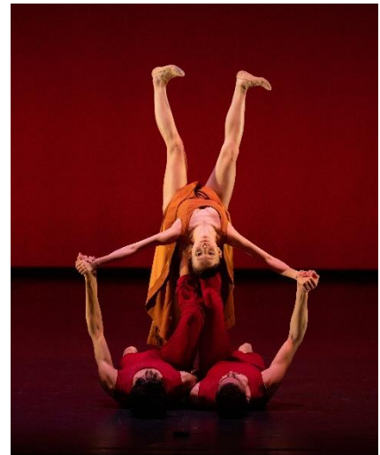
Danza Clásica (Neoclásico)