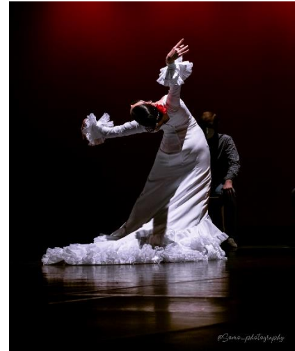
Danza Española (Flamenco)